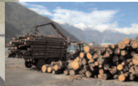
A sinistra, la centrale di Villa di Tirano, dove arriva il legname che alimenta la caldaia a biomasse. Ne esiste una di potenza inferiore che serve il territorio di Sondalo, mentre è già iniziata la costruzione di un altro impianto a Santa Caterina Valfurva.