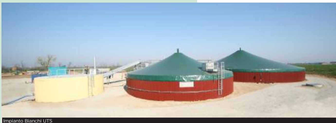
Impianto Bianchi UTS

parte contenere sfruttando l'energia prodotta col biogas e recuperando il calore dell'impianto, di norma disperso. Interessante anche lo strippaggio, che può essere sostituito alla fase di aerazione continua o di nitro-denitrificazione per la frazione liquida, che in questo processo viene riscaldata e sottoposta a insufflazione d'aria per volatilizzare l'ammoniaca e allontanarla, e successivamente catturarla in una torre di lavaggio mediante una soluzione acida. Si ottiene così una soluzione di solfato d'ammonio che può essere utilizzata per la produzione di fertilizzanti. Pur essendo una tecnica complessa, presen-