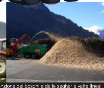
In queste immagini, alcune fasi degli scavi nei centri abitati di Tirano e Sondalo, durati due anni, per creare la rete di teleriscaldamento a biomasse, che si avvale del legno di manutenzione dei boschi e delle segherie valtellinesi.

gato della Tcvvv (Teleriscaldamento cogenerazione Valcamonica Valtellina Valchiavenna), una Spa che vede tra i suoi soci i Comuni della zona (oltre a Tirano e Sondalo, anche Livigno e Santa Caterina Valfurva), la Comunità montana Alta Valtellina, il Consorzio forestale ma anche la Banca popolare di Sondrio e tutte le segherie valtellinesi. «Per statuto, gli enti pubblici