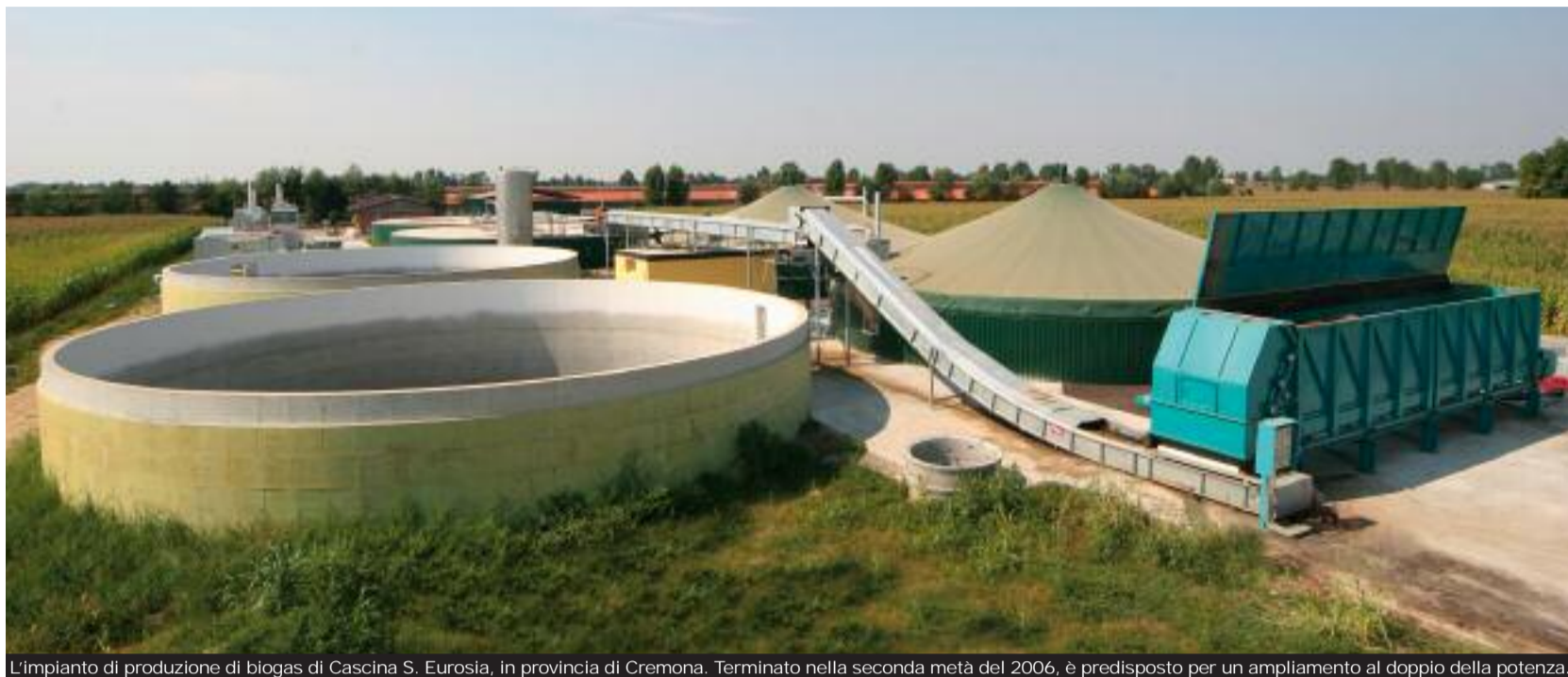
L'impianto di produzione di biogas di Cascina S. Eurosia, in provincia di Cremona. Terminato nella seconda metà del 2006, è predisposto per un ampliamento al doppio della potenza.

Se lasciamo lo scenario generale per esaminare il panorama agricolo, le sfide ambientali di fronte alle quali si trovano in questo momento gli imprenditori italiani (e lombardi in particolare) non sono da poco, considerando le problematiche indotte dalla complessa – e ancora aperta – questione nitrati e dal profondo rinnovamento in atto all'interno del sistema rurale, sempre più chiamato a confrontarsi direttamente con un mercato globalizzato e competitivo. Per vincere queste sfide è ormai chiaro che bisogna cercare strade alternative sempre più ecocompatibili, e le agro-